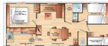
Riviera 3 6p. (9.27 x 4 m) 3 chambres (1 grand lit + 2x2 petits lits, dont 1 chambre lits superposés), grand réfrigérateur-congélateur, hotte aspirante, salon, grande terrasse, convecteurs dans toutes les pièces (basse saison uniquement), grandes baies coulissantes.