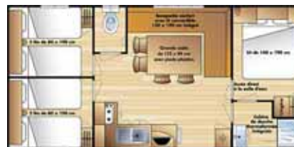
Super Titania 3 6 p. (7.92 x 4 m) 3 chambres (1 grand lit + 2x2 petits lits), salon, grand réfrigérateur.