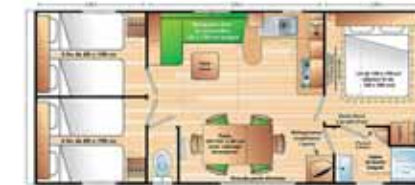
Super Cordelia 3 6 p. (8.67 x 4 m) 3 chambres (1 grand lit + 2x2 petits lits), grand réfrigérateur-congélateur, salon, grande terrasse.