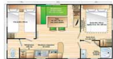
Super Mercure 4/6 p. (7.32 x 4) 2 chambres (1 grand lit + 2 petits lits), salon et banquette-lit, parasol. Modèle famille : emplacement lit bébé dans chambre parents.