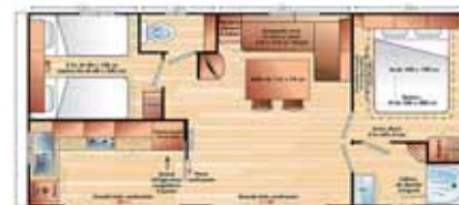
Riviera 4/6 p. (8.67 x 4 m) 2 chambres (1 grand lit + 2 petits lits), salon banquette-lit. Grande terrasse, convecteurs dans toutes les pièces (basse saison uniquement), hotte aspirante, grand réfrigérateur-congélateur.

2 chambres (1 grand lit + 2 petits lits), coin repas, eau froide, terrasse N.B. : pas de SDB, ni WC.