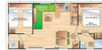
Super Titania 4/6 p. (8.07 x 4 m) 2 chambres (1 grand lit + 2 petits lits), salon banquette-lit. Grande terrasse, convecteurs dans toutes les pièces (basse saison uniquement), hotte aspirante, grand réfrigérateur-congélateur.