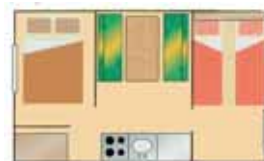
Mobil-Home sans sanitaires 4 p. (5.6 x 3 m)

2 chambres (1 grand lit + 2 petits lits), coin repas, eau froide, terrasse N.B. : pas de SDB, ni WC.