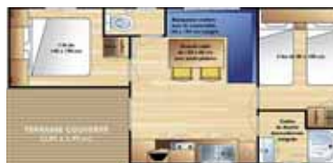
Loggia 4/6 p. (7.92 x 4 m) 2 chambres (1 grand lit + 2 petits lits), salon banquette-lit. Terrasse couverte, convecteurs dans toutes les pièces (basse saison uniquement), grand réfrigérateur.